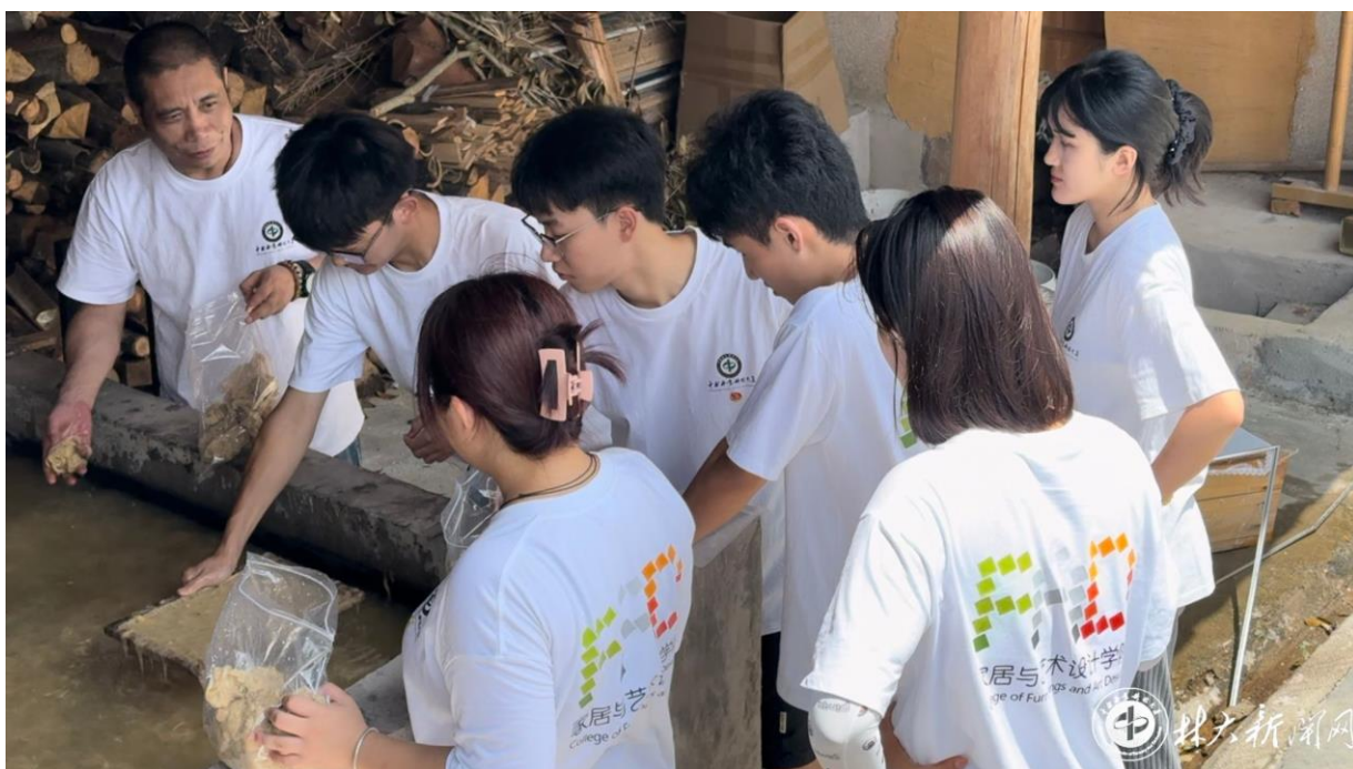
▲ 实践团实地调研记录非遗造纸工艺流程