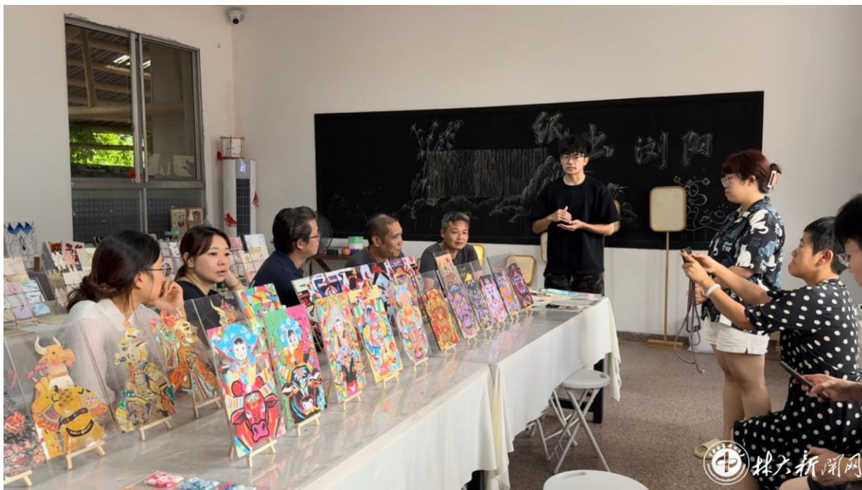
▲ 实践团在非遗就业工坊进行交流研讨

项目。通过实地观察、匠人访谈、实践体验与设计转化，团队完成了从文化感知到专业输出的闭环，用青春力量与专业智慧为非遗传承注入新活力。成果既赓续了百年造纸技艺的匠作精神，更以设计思维激活文化传承，彰显古法造纸在数字时代生生不息的创造活力。